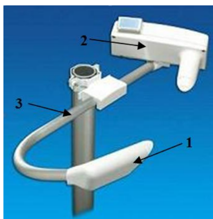
Рис.1 Нефелометры PWD Излучатель - 1, приемник - 2, кронштейн - 3,